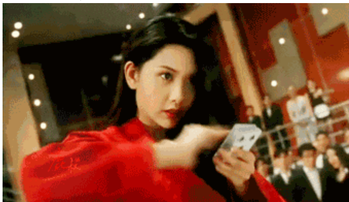
李连杰版《倚天屠龙记》里的小昭~